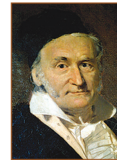
C. F. GAUSS